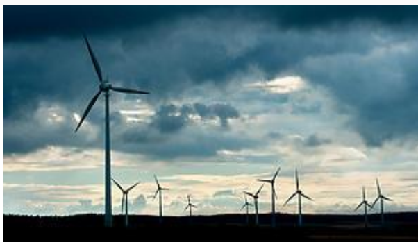
Windräder in Niedersachsen