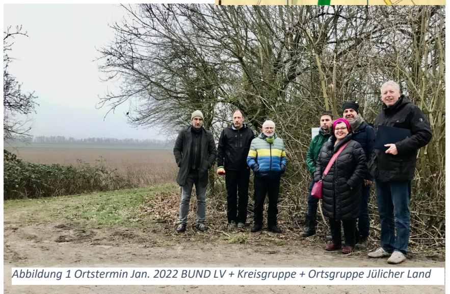
Abbildung 1 Ortstermin Jan. 2022 BUND LV + Kreisgruppe + Ortsgruppe Jülicher Land