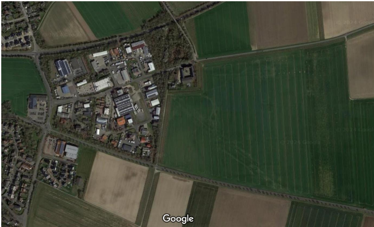
Luftbild vorhandenes Gewebegebiet und Flächen für das Industriegebiet H3

Das wird in den neuen Industriegebiet nicht mehr stattfinden. Durch die großen Industrieflächen und Erschließungsstraßen wird nur noch eine Begrünung an der L 263 stattfinden.