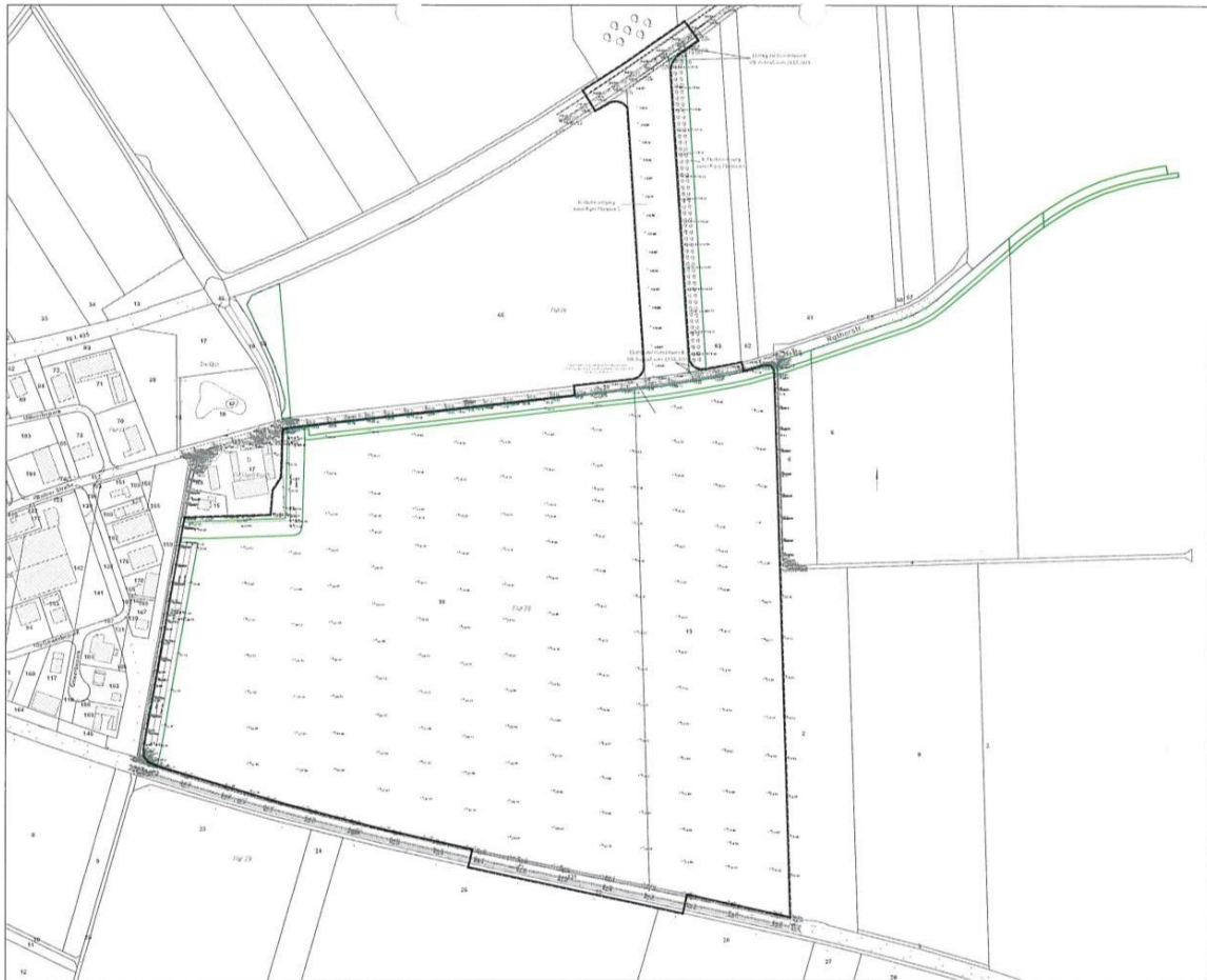
Abb. 5: Lage der artenschutzrechtlichen Maßnahmen für die Fortführung des Tagebaus Hambach

Bei Umsetzung der Planung würden diese artenschutzrechtliche Maßnahmen für die Fortführung des Tagebaus Hambach wertlos. Vergleichbare Nahrungshabitate sind für die Fledermäuse des Nörvenicher Waldes in der Nähe nicht vorhanden.