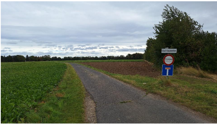
Blick von Eschweiler ü. Feld Richtung Gut Ollesheim.

Rechts die dicht bewachsene Bahntrasse und links die Ackerfläche. Es ist doch nicht sinnvoll auf der Bahntrasse alles zu fällen und dann neben dem Radweg, wie in der Vorlage der unteren Naturschutzbehörde des Kreises Düren, daneben wieder Begleitgrün neu zu pflanzen.